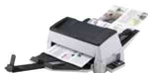
Alimentation du papier à trajectoire directe

Les modèles fi-7600 et fi-7700 s'adaptent automatiquement à tous les grammages de papier de 20 à 413 g/m 2 . L'alimentation du papier à trajectoire directe réduit la charge sur un document et permet une numérisation fiable indépendamment de l'état et du type de document. En faisant simplement glisser un levier pour passer en mode « non-séparation », vous pouvez facilement numériser des documents longs et épais pliés en deux, des jeux de documents multicouches et des enveloppes.