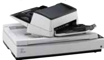
Chargeur automatique de documents mobile à 180 degrés

Les deux modèles de scanners proposent une conception éprouvée unique sur le marché qui s'adapte aux préférences et aux exigences de chaque utilisateur. Le chargeur automatique de documents du modèle fi-7700 glisse d'un côté ou de l'autre ou pivote de 180 degrés.