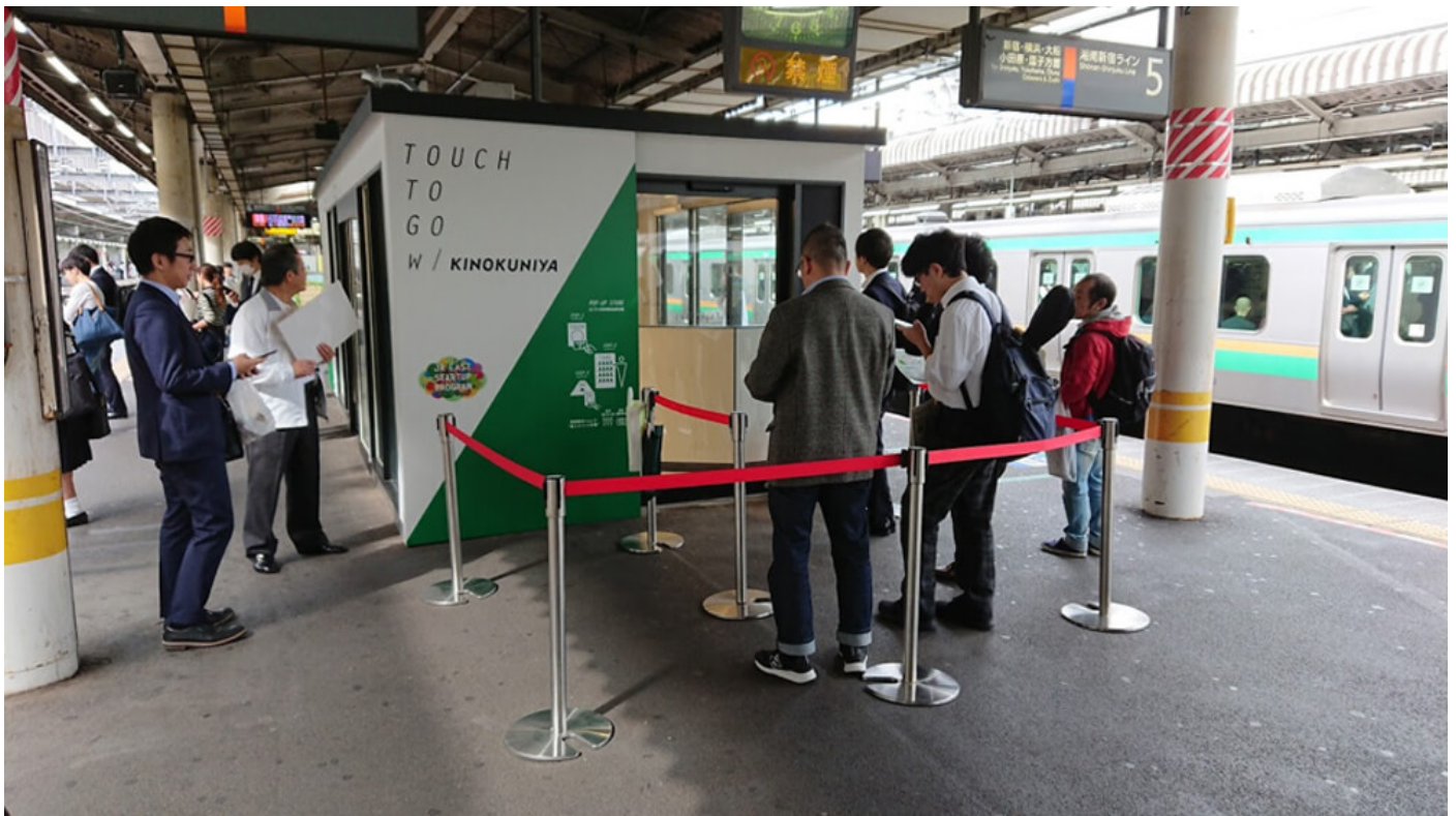
JR赤羽駅の5・6番線ホーム上に設置されたセルフ決済コンビニの実験店舗 現在は同時に入店できる人数が3名までと制限されている

JR東日本の無人コンビニの実証実験は、2017年11月の大宮駅での実験に続いて2回目となります。今回は前回よりも商品認識率と決済認識率を高めており、試験期間も前回は1週間でしたが今回は2カ月間となっています。今はまだ実験段階であるため、同時に入店できる人数や一回に購入できる商品数に制限がありますが、自動販売機と同じ感覚でコンビニを利用できるという新たな購入体験は新鮮です。