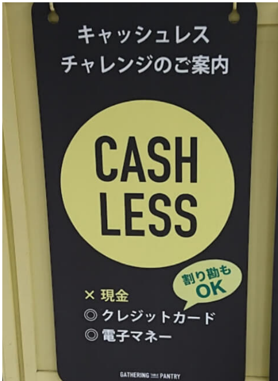
日本橋馬喰町で営業中のキャッシュレス店舗「GATHERING TABLE PANTRY 馬喰町店」と入り口脇に掲げられたキャッシュレスの案内