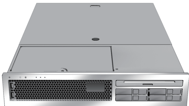
図 1 SPARC Enterprise T2000 サーバ

本書では、プレインストールされた Solaris™ オペレーティングシステム（Solaris OS）を使用して最初に本体装置に電源を投入し、本体装置をブートするときの手順を簡単に説明します。