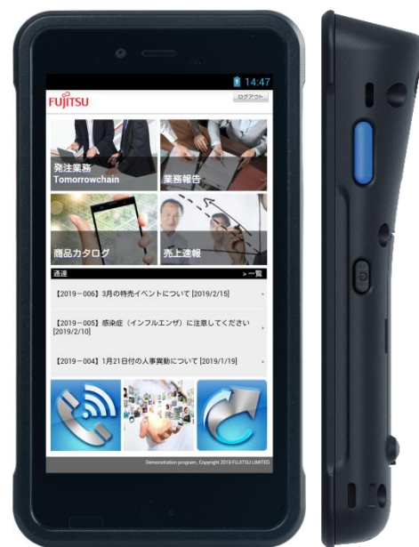
標準バッテリータイプ