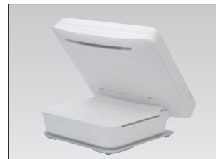
ロイヤルホワイト