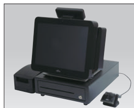
オーシャンブラック POS構成例（磁気カードリーダー接続時）