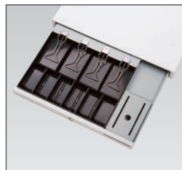
薄型ドロア (紙幣4区分、硬貨6区分)