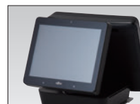
カスタマー LCD (12.1 型)