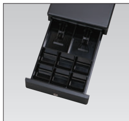
小型ドロア (紙幣2区分、硬貨6区分)

省スペース分離設置用の小型ドロアから大容量の大型ドロアまでの3タイプに加え、自動釣銭釣札機接続に適した薄型ドロアも選択できます。