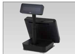
カスタマーディスプレイ（一体設置タイプ）