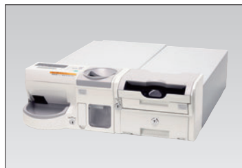
自動釣銭・釣札機 モデルF77

お釣りを自動的かつスピーディーに払い出し、お客様へのサービス向上を図るとともにオペレーターの負担を軽減します。