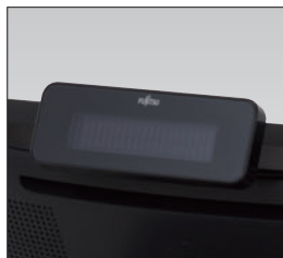
小型カスタマーディスプレイ

本体と一体になった小型カスタマーディスプレイをはじめ、高さ調節可能なカスタマーディスプレイ、お客様への多様な情報提供を可能にする12.1型・15型のカスタマーLCDをラインナップ。カスタマーディスプレイの表示方式は漢字タイプ/ANKタイプから選択できます。