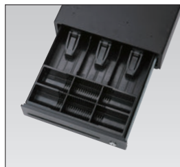
中型ドロア (紙幣3区分、硬貨6区分)