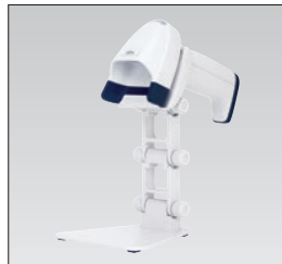
ハンディカメラスキャナ (スタンドはオプション)