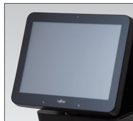
12.1型/15型カスタマーLCD (写真は15型)