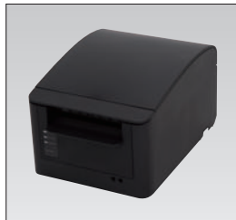
レシートプリンター