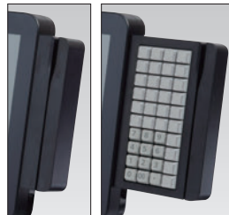
左：磁気カードリーダー 右：チームキーボード (40キー)