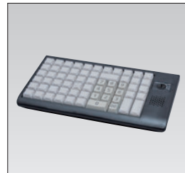
小型POSキーボード (66キー)