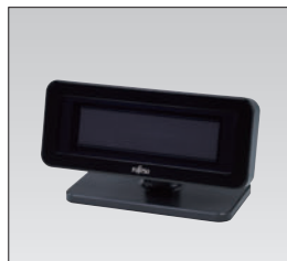
カスタマーディスプレイ (分離設置)