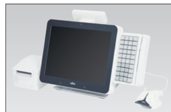
ロイヤルホワイト POS構成例（キーボード接続時）