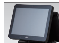
カスタマー LCD (15 型)