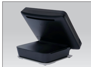
オーシャンブラック