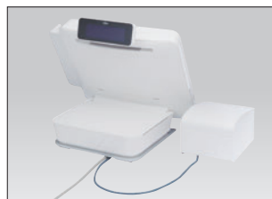
ACケーブル1本のすっきりした設置