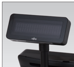
カスタマーディスプレイ (一体設置)