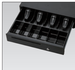
大型ドロア (紙幣4区分、硬貨3区分×2)