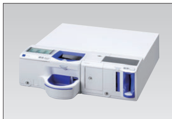
グローリー株式会社製 (RT-300/RAD-300、RT-300T)