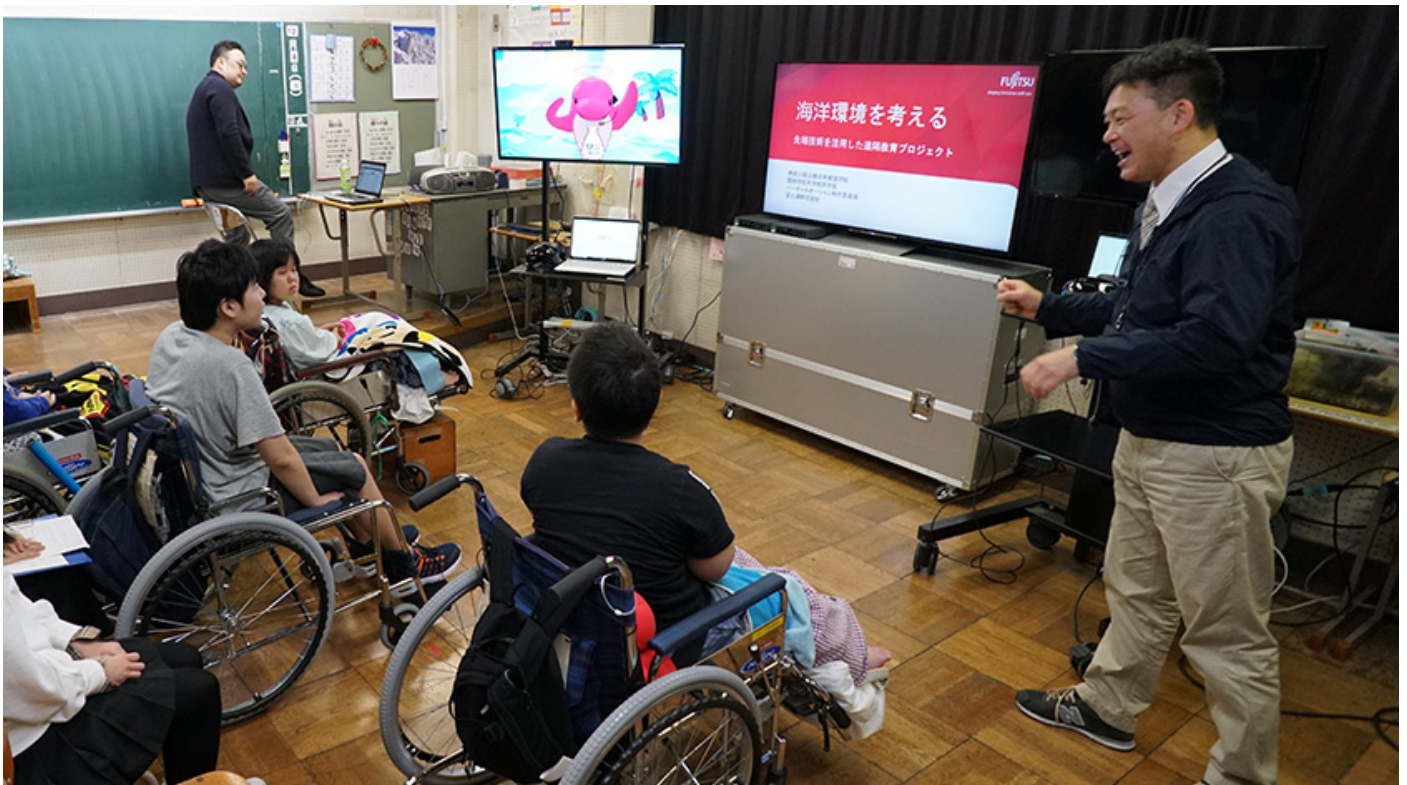
横浜南養護学校 教室の様子