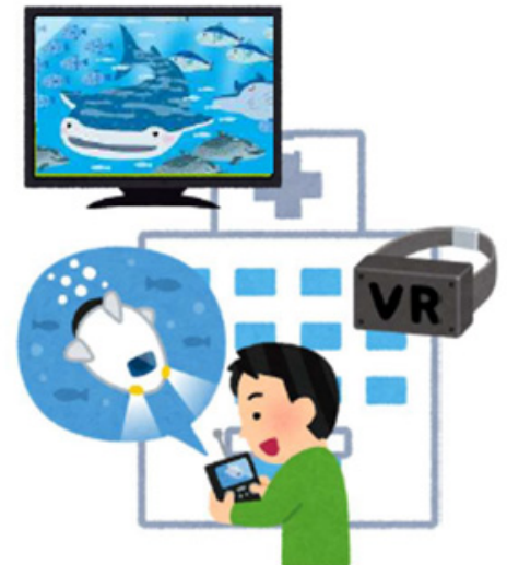
八景島シーパラダイスと横浜南養護学校を結んだ実証実験の概要図