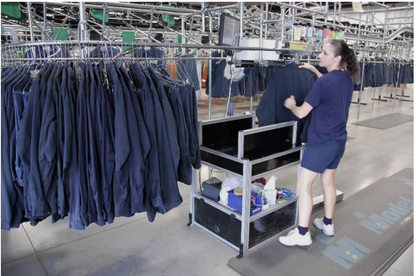
北米クリーニング工場での利用シーン

ここでいう品質とは、一つは強度ということになるでしょう。リネンタグは圧力脱水の強烈な力にも十二分に耐えられるのみならず、他の様々な面でも過酷な条件をクリアしています。例えば、国によってはクリーニング時に使う洗剤が、リネンタグ内の接着剤を溶かしてしまうことがあることから、あらゆる角度からの検討はすでに実施済み。また、タグの取り付けに200℃のアイロンで圧着することがあるため熱への耐性も持たせていますし、病院での利用を想定しているため滅菌処理にも対応しています。