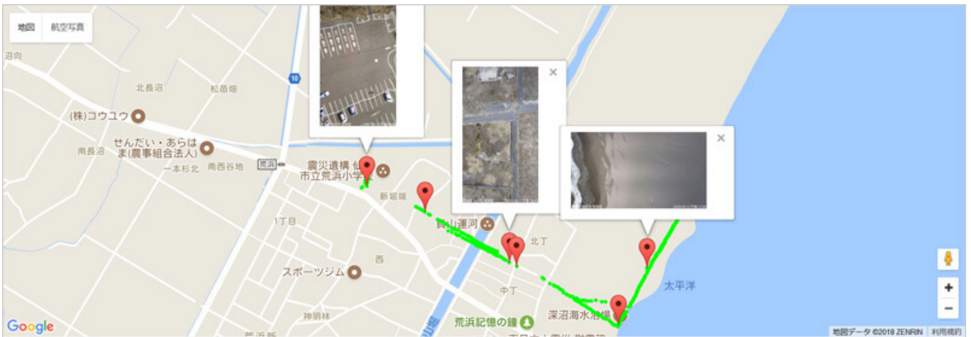
震災状況のキャプチャ画面

(注2) ブロックチェーン技術の機能拡張によって、データを外部環境へ預けることなく、自身の持つ環境に置いたまま必要な相手のみとデータの相互利活用が可能な技術。