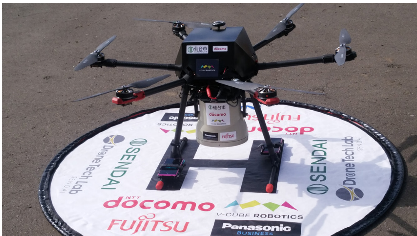
実証実験に使用したドローン

（注1）経済社会の構造改革を重点的に推進することにより、産業の国際競争力を強化するとともに、国際的な経済活動の拠点の形成を促進する観点から、国が定めた区域。