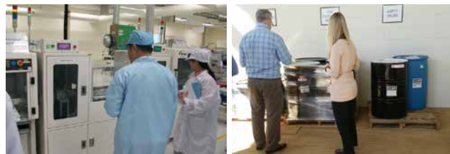
海外での内部監査の様子

また、海外では、現地の法規制・運用を熟知している外部機関の専門家の協力を受け、コンプライアンス強化を目的とした内部監査を実施しました。その結果、指摘内容については、50%以上を「法的及びその他の要求事項」、「運用管理」が占めました。