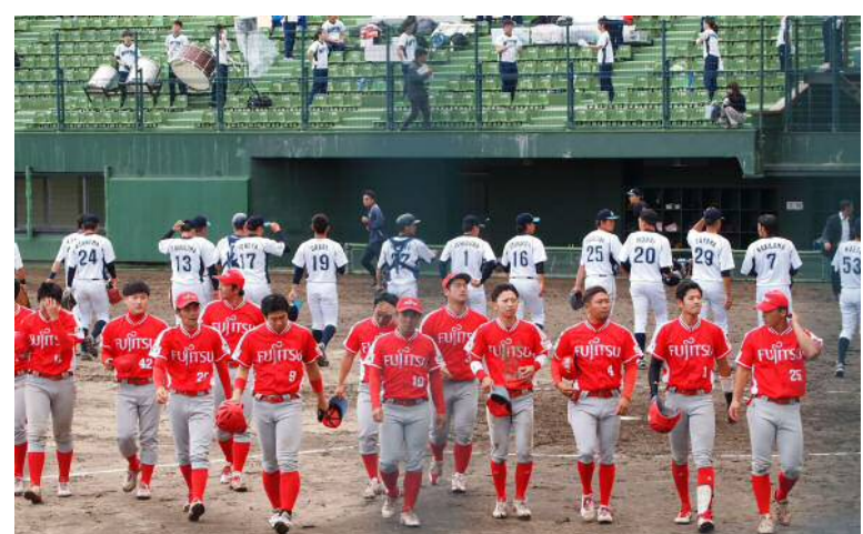
昨年の都市対抗二次予選(岩手)で強豪企業チームに善戦！