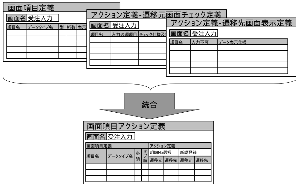
図-2 ドキュメント統合の例 Fig.2-Example for integration of documents.