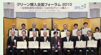
「グリーン購入大賞」受賞式の様子

当社グループが、生物多様性保全をお取引先に促している点や、お取引先へのガイドラインの提供、評価指標の策定など、活動の先進性と独自性が高く評価されたものです。