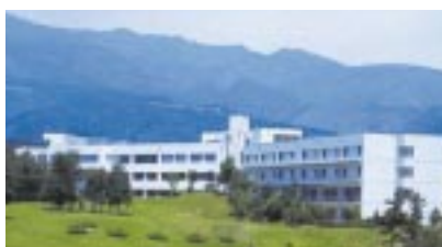
研修施設、富士フォーラム(沼津工場内)