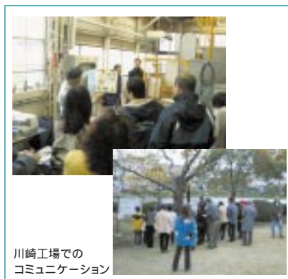
川崎工場でのコミュニケーション

私たちの事業に関わる幅広い皆さまと直接お話し、そのご意見を環境活動の改善に活かしていくため、新たな取り組みとしてステークホルダー・コミュニケーションを始めました。今回、川崎工場周辺の地域住民の方々を対象に、工場内施設見学と環境活動の説明を行いました。これからも、それぞれの立場の方々から活発なご意見をお聞きするためのコミュニケーションを引き続き実施していく予定です