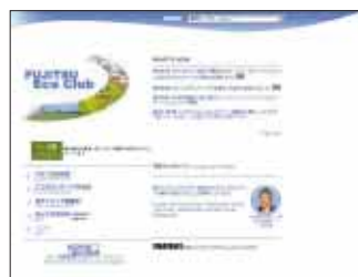
FUJITSU Eco Clubホームページ

「社員の、社員による、社員のための」環境貢献活動を支援する目的で、2001年6月に開設しました。このクラブは社内でのイントラネット上で運営され、関係会社、部、グループ、個人単位で環境ボランティア活動を行っている方々の交流の場です。現在、ボランティア募集の案内や掲示板による意見交換など、さまざまな活動が行われています。当社で実施するすべてのボランティア活動および海外・国内の緑化活動を支援しています。