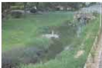
ピオト-プ(富士通小山工場)

2001年3月、富士通小山工場において、生物多様性緑化活動の一環としてピオトープ *1 を開設しました。川に放流する工場排水の鯉・フナなどによる生物監視、ヨシ・カヤなどの水生植物による自然浄化、従業員の憩いの場の創出など、さまざまな効果があります。初代社長の「自然と共生した工場づくり」の意志を継ぎ、これからも工場・事業所の緑化を進めていきます。