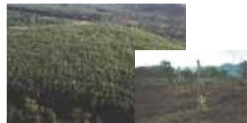
パプアニューギニアの植林木

自然林を保護し、地球温暖化対策に貢献するため、2002年版カレンダーから植林した樹木だけを原紙として利用しています。この樹木は王子製紙株式会社様がパプアニューギニアに植林したアカシアの木で、2002年版カレンダー約50万部に、植林木から採取した約200トンの紙を利用しました。