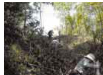
ボランティアによる植林活動(マレーシア)