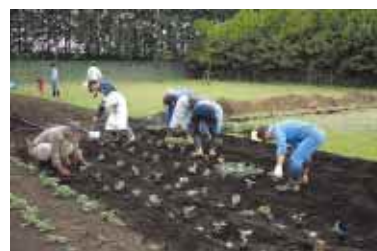
菜園ボランティア

富士通沼津工場：従業員(関係会社や家族を含む)に参加してもらい、工場内の実験農園(菜園)の手入れを行う、新しい形態のボランティア事業を始めました。現在、35名の方々がメンバーとして登録し、ナスやジャガイモなどをつくっています。