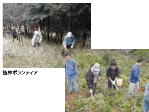
植林ボランティア

富士通サポートアンドサービス：同社神奈川支社の方々が中心となり、かながわ森林づくり公社主催の森林づくりボランティア(神奈川県内)に1999年度より毎年参加しています。