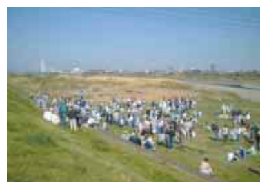
多摩川清掃ボランティア

富士通南多摩工場：例年、地域社会貢献の一環として、国土交通省・稲城市が主催する「多摩川清掃ボランティア」に地域の皆さんと一緒に参加しています。