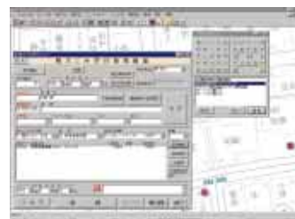
廃棄物収集情報管理システム「CLENALIFE」