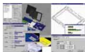
環境配慮型設計支援システム 「VPS/Eco Design」