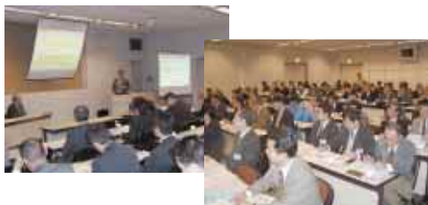
グリーン調達基準説明会(富士通川崎工場)