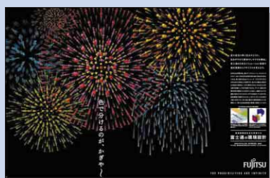
日刊工業新聞(2001年8月28日付)に掲載。