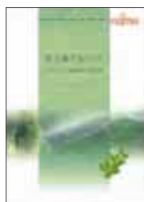
グリーン調達パンフレット

環境問題に対し積極的に取り組んでいる企業から優先的に調達を行い、お取引先と連携した環境活動を実施するために、お取引先の環境問題に対する企業姿勢の評価を行っています。2000年度は、主要取引先379社に対して、当社が表明した「グリーン調達のご案内」の内容についてアンケート調査を実施しました。このアンケート結果をもとに、2001年度から始まる第3期環境行動計画では「グリーン調達」の目標を設定し、当社基準を満たしていないお取引先にも改善活動の協力をお願いしていきます。