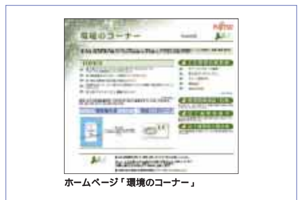
ホームページ「環境のコーナー」

インターネットによる情報発信件数(2000年度) 社外ホームページ 日本語:54件 英語:19件 社内ホームページ 日本語:192件 英語:35件 お問い合わせ件数 683件(国内607件、海外76件)