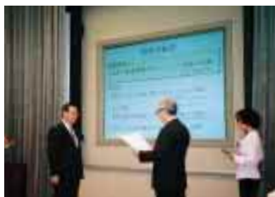
環境貢献賞 表彰式

2000年度は73件(国内69件、海外4件)の応募があり、環境貢献賞5件(うち最優秀賞1件)、環境貢献奨励賞10件が選ばれ、環境本部長による表彰式を実施しました。