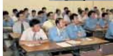
環境講演会(熊谷工場)