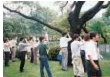
野鳥セミナー(川崎工場)