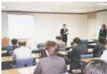
環境ビジネス講座

環境教育に関する全社共通規格である「環境教育実施規定」に基づき、各種の技術教育および一般教育を実施しました。2000年度は新規の講座として、営業部門の幹部社員・担当者向けに「環境ビジネス講座」を開始しました。その目的は、地球環境問題に取り組む重要性についての認識をさらに深めること。また、環境を重視されるお客さまが増えてきていることから、環境に関する新しいビジネスを発掘・提案できる力をさらに高めることです。これにより、設計・開発、一般、営業部門向けの教育体系となりました。