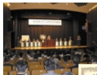
リサイクル推進功労者 表彰式