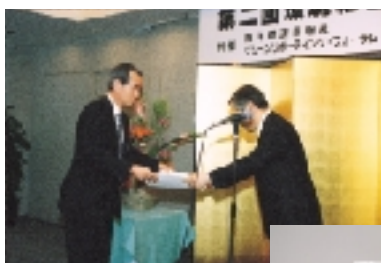
環境報告書賞表彰式