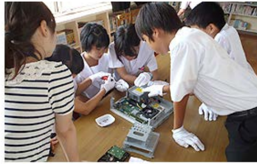
福岡県直方市立植木中学校(リソコン分解)