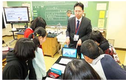
神奈川県相模原市立若松小学校(電気の変身)