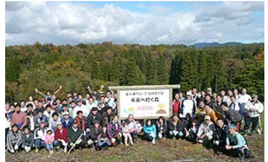
「富士通グループ・加賀百万石 未来へ続く森」植樹活動

2012年度は、6月、8月に「下草刈り」、10月には刈り取った雑草雑木を土砂流出防止のため並べて置く「筋置き作業」、11月にはコブシやヤマモミジの苗100本の植樹を実施。全4回の活動には合計340名が参加しました。四季を通じて山を彩る木を植え、集まる人が楽しめる森を作っていきます。