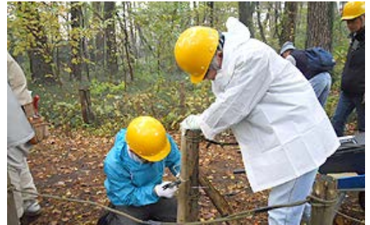
東京グリーンシップアクション

2012年度は11月に実施し、清瀬市の南西部に位置するアカマツを主体とした雑木林や、ニセアカシアの若齢林、草地、多くの立木などが存在している清瀬松山緑地保全地域において、富士通グループ社員・家族20名が、保全地域内の木柵の補修や、看板と巣箱の制作などを行いました。なお、市街地の中では希少となったアカマツを中心とする平地林は、多様性に富んだ自然空間としてできる限り現状のまま保全することを基本としています。