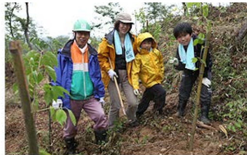
植林活動の参加者