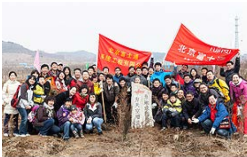
植林活動に参加したBFS社員とその家族

BEIJING FUJITSU SYSTEM ENGINEERING CO., LTD. (BFS) では、自然環境保全活動の一環として、2012年3月23日に北京郊外で植林活動を実施しました。BFS本社の社員およびその家族約100名が参加し、全108本の苗木を植樹しました。