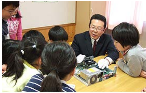
京都府長岡京市立長法寺小学校(リソコンリサイクル)