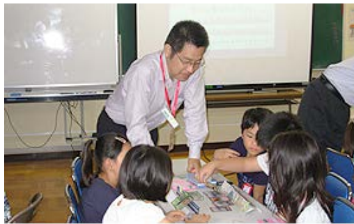
東京都品川区立浜川小学校(マイアース)