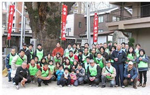
参加した社員とその家族