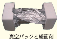
真空パックと緩衝剤

トナーの特性は温度や湿度により大きく変化してきます。富士通純正トナーカートリッジは、長時間の保管にも耐えられるよう吸湿しない材料で、かつ真空パックを施しています。