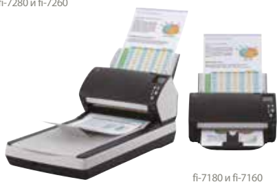
fi-7180 и fi-7160

fi-7160/fi-7260 – A4 пейзаж при разрешении 300 точек на дюйм, 60 страниц в минуту / 120 изображений в минуту fi-7180/fi-7280 – A4 пейзаж при разрешении 300 точек на дюйм, 80 страниц в минуту / 160 изображений в минуту Сканирование смешанных партий документов с помощью накопителя на 80 листов