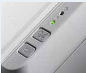
Painel de operação

O design simples e de fácil uso pode minimizar os processos de digitalização e reduzir o erro humano. O SP-1120 possui um painel de operação simples com apenas 2 botões (Digitalizar/Parar e Potência). Depois de pré-regular o Presto!™ PageManager™ *4 , um único toque no botão Digitalizar é necessário para armazenar instantaneamente os dados de imagem do documento.