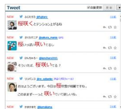
タイムライン表示