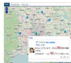
地図表示（ポップアップ）