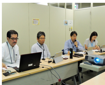
富士ゼロックスサービスクリエイティブ様におけるLiveTalk使用風景

富士ゼロックスとその関連会社の販売事務機能、コンタクトセンター機能および経理・会計機能を担う富士ゼロックスサービスクリエイティブ様は、各種サポート・サービスをワンストップで提供しています。行動指針の一つを「私は、『思いやり』と『感謝』の気持ちをもって行動し、社内外のコミュニケーションの活性化に努めます。」とし、障がいのある社員とのコミュニケーション環境の改善にも前向きに取り組んでいます。