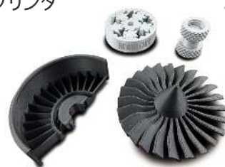
3Dプリンタによる制作サンプル