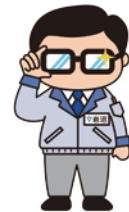
岩沼市 マスコットキャラクター 「岩沼係長」

©本カタログに記載されている会社名、商品名は、各社の商標または登録商標です。本カタログに記載されているシステム名、製品名などには必ずしも商標表示(TM,®)を付記していません。 ©本カタログに記載の内容は2017年10月現在のものです。内容は予告なく変更することがありますので、あらかじめご了承ください。