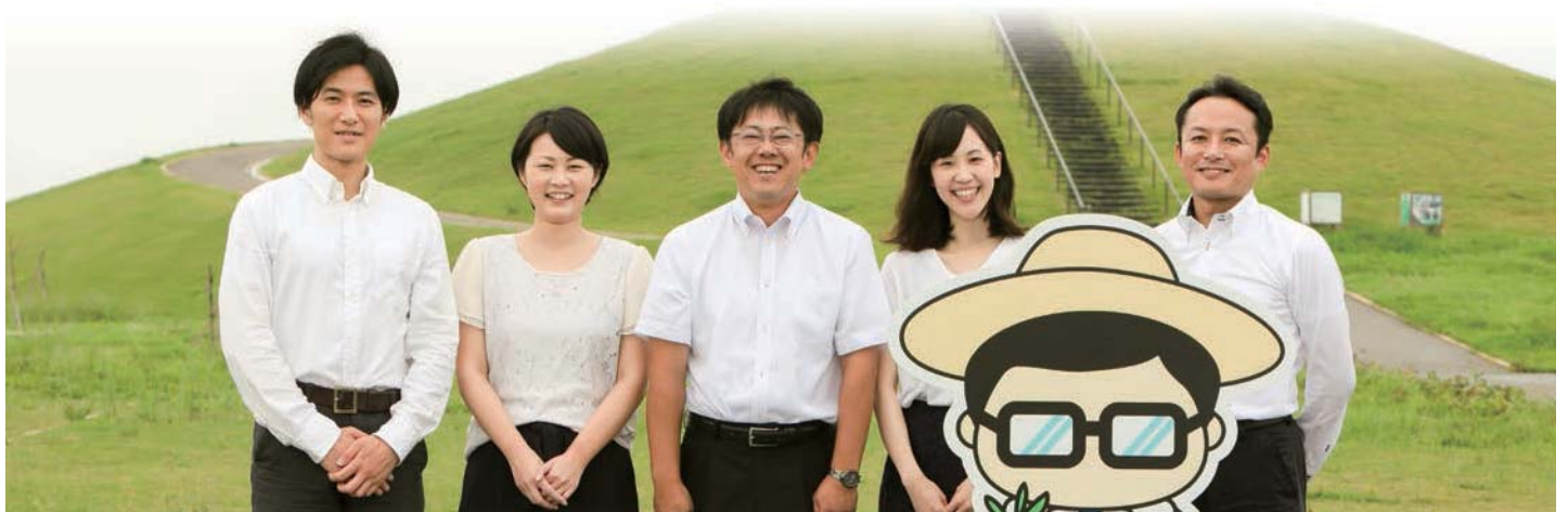
「千年希望の丘」にて、岩沼市マスコットキャラクター「岩沼係長」とともに。