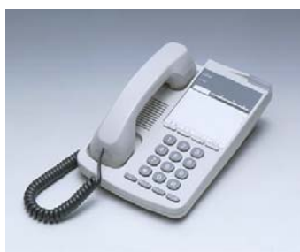
iss phone 20B