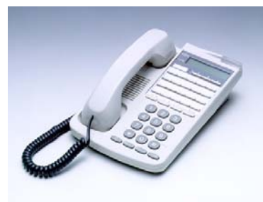
iss phone 20D