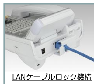
LANケーブルロック機構