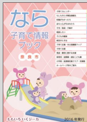
▲パンフレット「なら子育て情報ブック」

奈良市様の子育て支援情報パンフレット「なら子育て情報ブック」を作成。緊急時の連絡先、相談先、手当や助成の情報、施設情報など、地域の子育てに役立つ情報を集約し、わかりやすく整理。