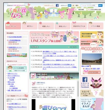
▲Webサイト「子育て@なら」

奈良市様の子育て支援情報ポータルサイト「子育て@なら」を作成。サイトを利用するお父さん、お母さんの目線で、子育てに関する最新の情報をすぐに入手できるように工夫したコンテンツを設置。