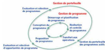
Gestion des bénéfices d'un programme ou d'un portefeuille de programmes

Station Résultats fournit le processus Gestion de portefeuille et un processus appelé Gestion de programme.