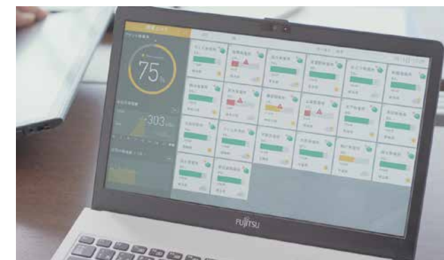
太陽光発電システムに設置されたセンサーから発信される各種データ