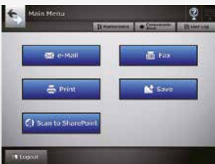
Schermo menu principale

Un kit SDK è disponibile per lo scanner N7100 per soddisfare ulteriormente le esigenze aziendali. Questo kit SDK consentirà lo sviluppo di un connettore in un'applicazione di terze parti preferita, sia questo un sistema DMS, ECM, BPM o ERP. Questo connettore a sua volta viene caricato allo scanner N7100 e agisce quindi come un singolo tasto di apertura della porta nei sistemi di destinazione produttivi. Il kit consente inoltre di utilizzare i lettori IC collegati alla porta USB dello scanner di rete.