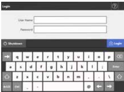
Schermo di accesso

Quando lo scanner N7100 viene inizializzato, le aree libere della memoria interna possono essere sovrascritte con dati assolutamente casuali e privi di significato e come misura di sicurezza aggiuntiva, viene generata una nuova chiave di crittografia dopo aver eliminato tutte le informazioni dell'utente. Tutte queste precauzioni eliminano la possibilità di recuperare tracce dei vecchi dati utente accedendo alla memoria.