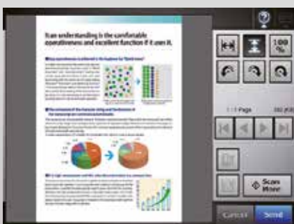
Schermo anteprima (visualizzatore Scan)