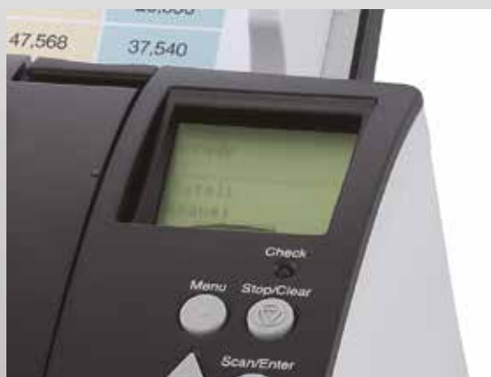
Panel de funcionamiento con pantalla de cristal líquido integrada

Los fi-7180, fi-7280, fi-7160 y fi-7260 incorporan funciones de administración central que los administradores de sistemas pueden utilizar para gestionar la instalación y funcionamiento de múltiples escáneres, monitorizar el estado de funcionamiento y actualizar los controladores y el software desde una única ubicación. Esta funcionalidad reduce drásticamente el coste y el trabajo requeridos en la configuración, funcionamiento y mantenimiento de un gran número de escáneres en una misma organización y también en la expansión de la red de escáneres a múltiples ubicaciones.