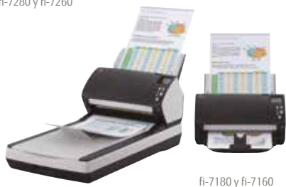
fi-7180 y fi-7160

fi-7160/fi-7260 – A4 vertical a 300 ppp 60 ppm / 120 ipm fi-7180/fi-7280 – A4 vertical a 300 ppp 80 ppm / 160ipm Digitalice lotes mezclados mediante el alimentador de 80 hojas