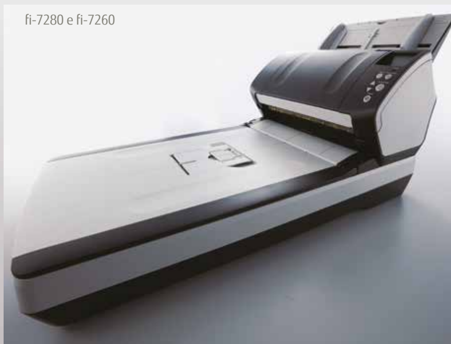
fi-7280 e fi-7260