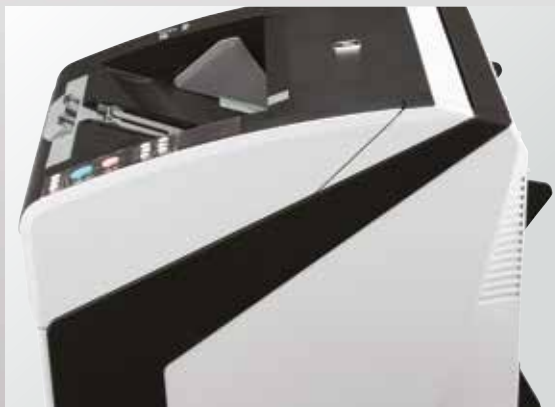
Сканер fi-6800 вид сбоку

Операторы могут эффективно работать со смешанными партиями документов, в которых варьируются физические характеристики документов. Сканер fi-6800 умеет работать с листами разных размеров (от A8 до A3) и с разными материалами, такими как бумага, картон и пластик разной плотности и толщины — при этом оператор может свободно выполнять параллельные задачи, не отвлекаясь на предотвратимые нарушения подачи.