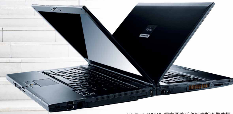
LifeBook S6410 拥有至尊版和标准版以供选择, 本彩页介绍均为至尊版, 标准版配置详见配置表。