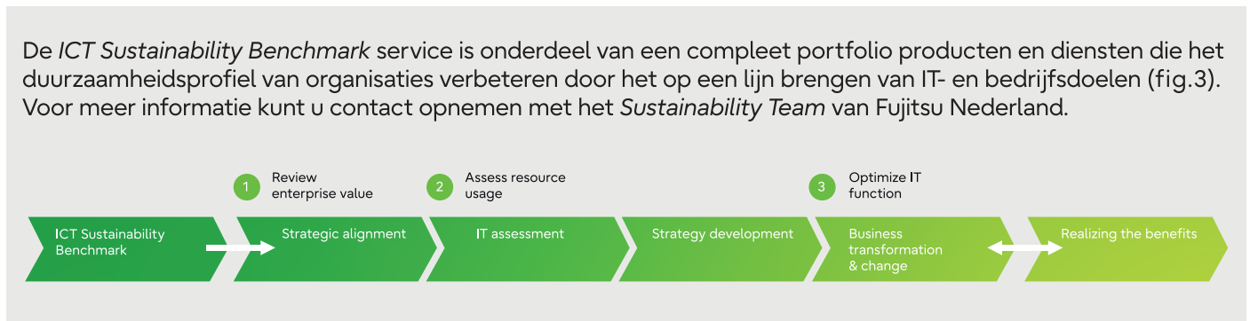
Figuur 3 - Fujitsu framework for aligning IT

https://www.fujitsu.com/global/about/purpose/