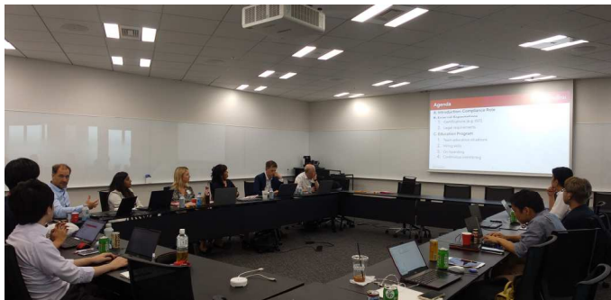
コンプライアンス責任者会議

また、各リージョンにコンプライアンス業務に従事する責任者を配置し、富士通グループ各社におけるリスク・コンプライアンス責任者とグローバルなネットワークを形成した上でグローバルコンプライアンスプログラムの実行体制を確保しています。2022年度は、各リージョンからコンプライアンス責任者が来日し、今後のグローバルなコンプライアンス施策について議論しました。