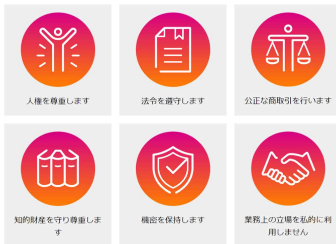
Fujitsu Way の行動規範

なお、従業員の評価制度には、Fujitsu Way の「大切にする価値観」の体現度合いが評価基準として組み込まれています。「大切にする価値観」には、「倫理感と透明性を持ち誠実な行動すること」が含まれており、行動規範の遵守が従業員の評価および報酬に反映されています。